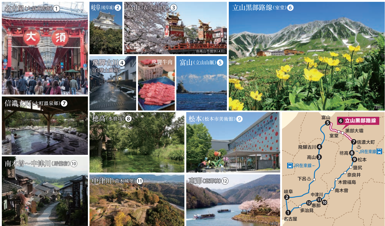
可搭乘的JR線、立山黑部 阿爾卑斯路線以及觀光地區的示意圖。記載的設施等可能需要另行支付入場費與交通費。

・立山黑部 阿爾卑斯路線中，可觀賞到雪之大谷的4月~6月預計人多擁擠，利用此路線的交通運輸將可能需要等候時間。 ※ 乘坐立山~扇澤的各交通工具時，須在立山站或扇澤站的車站窗口出示本券，並領取搭乘對應區間專用之「乘車票」。 ・在富山區域到信濃大町的區域之間，可以使用行李寄送服務。（需收費）